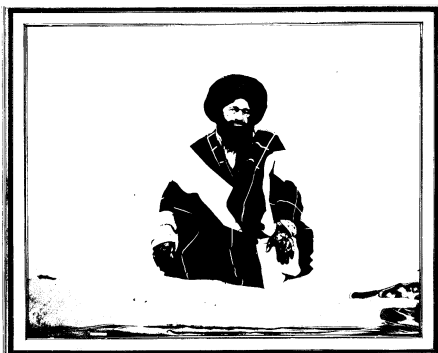
میرزا ابراهیم شریعتمداری