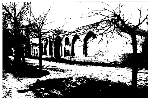
مدرسه شریعتمدار، نمای بیرونی مدرسه دید از شمال شرق

دیگر نیز در انتهای این ضلع قرار دارد که از اتاق دارای پوشش گنبدی در ضلع جنوب شرقی اکنون به عنوان آشپزخانه استفاده می‌شود. اتاق ضلع شمال شرقی نیز که دارای دو قسمت است - که بخشی به طاق گنبدی و بخشی به طاق گهواره‌ای پوشش شده است - احتمالاً این قسمت به عنوان کتابخانه مورد استفاده بوده است. زاویه شمال شرقی مدرسه دو طبقه است که در زیرزمین آن، سرویسهای بهداشتی قرار دارد. حجره‌های مدرسه در ضلع شمالی و جنوبی واقع شده که در هر ضلع، پنج حجره قرار گرفته است. کف حجره‌ها نسبت به حیاط حدود چهل سانتیمتر ارتفاع دارد. هر حجره دارای یک پیش طاق است. این پیش طاقها خیز کم و سقف هلالی شکل دارند. در هر ضلع حجره میانی که در محور تقارن بنا قرار گرفته است، نسبت به حجره‌های جنبی بزرگ‌تر است و در دو طرف ورودی حجره نیز دو طاقچه تعبیه شده است. هر یک از حجره‌ها دارای دو درگاه، چهار طاقچه برای گذاشتن وسایل و یک اجاق می‌باشد که اجاقهای داخل حجره‌ها در مرمت‌های اخیر مدرسه مسدود شده است. در جلو ورودی حجره‌ها در زیر پیش طاق نیز اجاق دیگری تعبیه شده است که اجاق داخل برای گرم کردن و اجاق بیرونی برای پخت و پز استفاده می‌شده است. با توجه به اینکه مدرسه در کنار مسجد قرار داشته، دارای مسجد نبوده است.