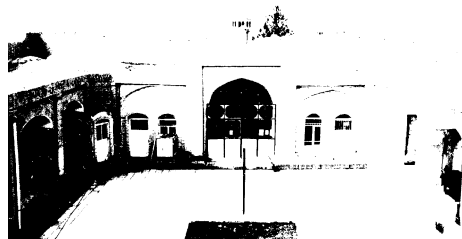
مدرسه شریعتمداری، ایوان غربی و مدرسه‌های دوسوی ایوان

روستا انجام شده است. از جمله اشکالاتی که در مرمت بنا وجود داشته است تعویض درها و پنجره‌های بنا با پنجره و درهای آهنی است که اصالت بنای تاریخی را خدشه‌دار نموده است. بستن جلو ایوان تابستانی مدرسه با در فلزی نیز از جمله اشکالات مرمت می‌باشد. کف حیاط به وسیله موزائیک مفروش شده که می‌توان به جای آن از آجر فرش استفاده کرد. اجاقهای تعبیه شده در حجره‌ها در مرمت‌های اخیر مسدود شده