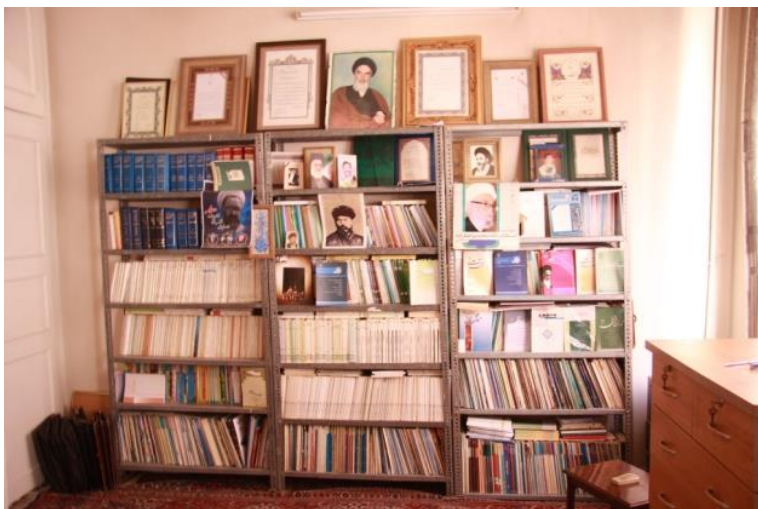
قفسه مجلات در منزل استاد نمایی از کتابخانه استاد در منزل